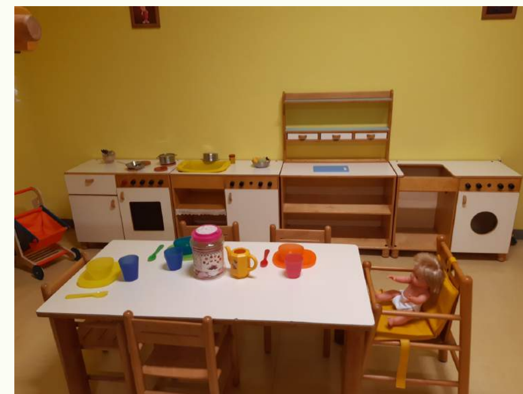
Spazio per i grandi (18-36 mesi)