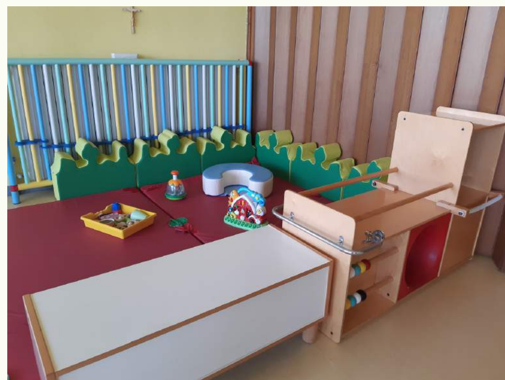
Spazio per i piccoli (3-18 mesi)

Gli spazi sono suddivisi secondo le età e le necessità di gioco dei/le bambini/e.